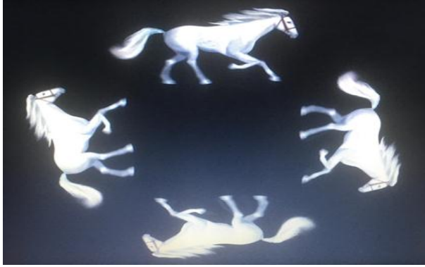
شكل (١): فيديو الهولوجرام المكون من أربعة نسخ متقابلة

ثانياً: يتم إنتاج منشور زجاجي بشكل هرمي له أربعة جوانب بزاوية ٤٥ درجة في كل جانب من الجوانب الأربعة للشكل، ثم نقوم بوضع شريط لاصق شفاف لنقوم بتوصيل الأجزاء الزجاجية الأربعة ببعضها.