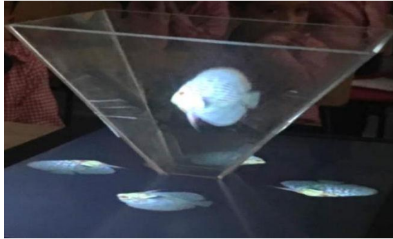
شكل (٢): شكل الصورة الهولوجرامية الثلاثية الأبعاد باستخدام المنشور الزجاجي الهرمي

ثالثاً: يتم وضع المنشور الزجاجي الهرمي على شاشة الكمبيوتر المحمول أو التابلت، بحيث يكون الهرم المقلوب في منتصف الفيديو الرباعي، ومن ثم يعكس المنشور الزجاجي الفيديو من الأربعة اتجاهات فتظهر صورة واحدة في الهواء بشكل ثلاثي الأبعاد، وبدون أي حائل، وكأنها صورة حقيقية وليست وهماً شكل (٢):