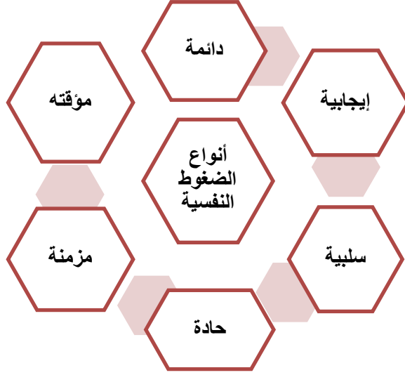
شكل لتوضيح أنواع الضغوط

مما سبق يتضح أن الضغوط التي يمر بها الفرد لا تقتصر على الجانب الداخلي للشخص فقط بل ويتعدى ذلك إلى البيئة والعمل، فيشير (Bowser,2000:25) في هذا الاتجاه قائلاً أن الضغوط التي يمر بها الفرد في البيئة والعمل بالإضافة إلى الجوانب الشخصية تؤثر جميعها بالسلب على إنتاجيته وعلاقته مع الآخرين.