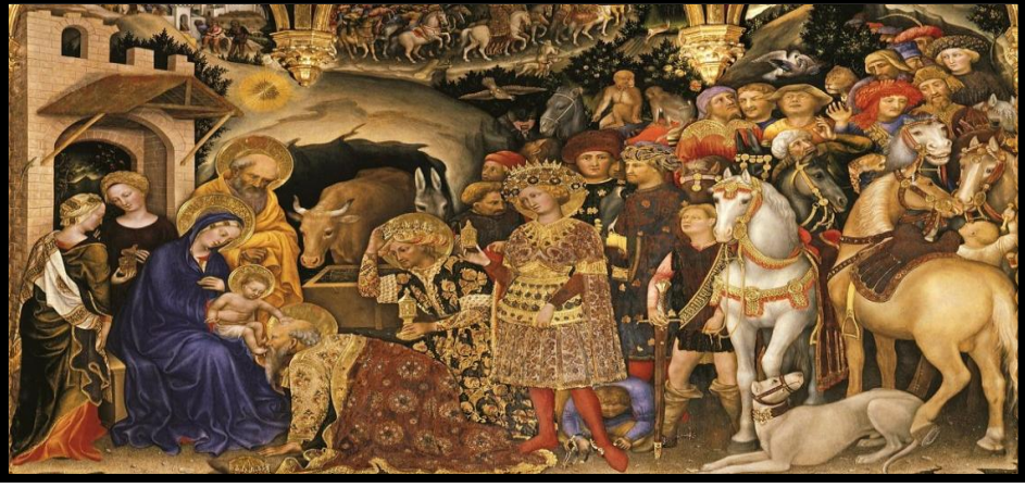
شکل رقم ( ٣ )

شکل رقم ( ٣ ) : اللوحة أعلى توضح الخط العربي في زخرفة أوشحة وهالة السيدة العذراء لوحة ( تيجيل المجوس ) للفنان جنتيلي دا فابريانو .