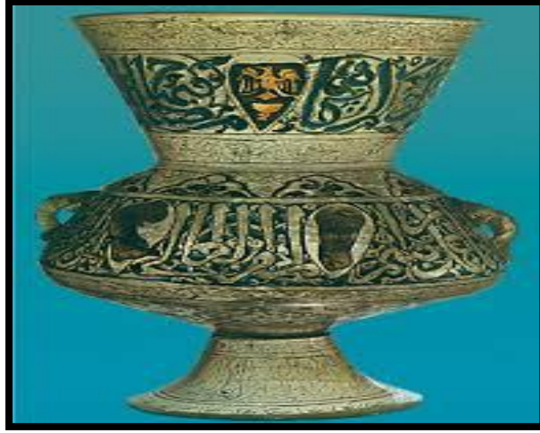
شكل رقم ( ١ )

شكل رقم (١) : إناء فخاري مكتوب علىه بالحروف العربية و الزخارف الإسلامية .