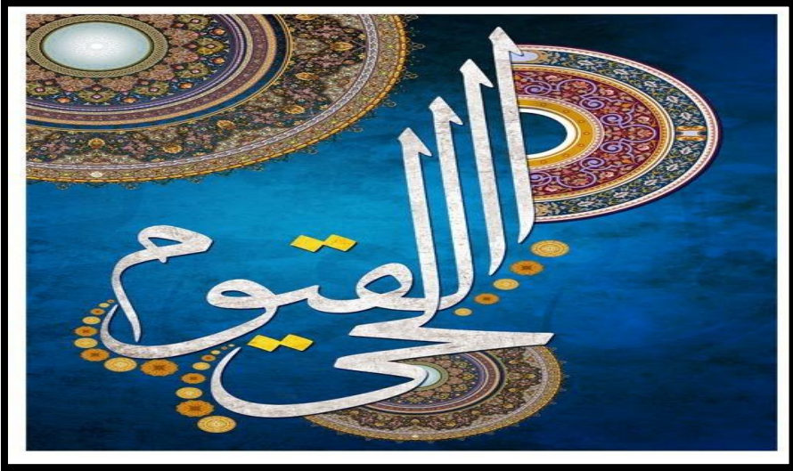
شکل رقم ( ٤ )

الشکل رقم ( ٤ ) : لوحة حروفية زخرفية من الخط العربي و الزخارف الإسلامية .