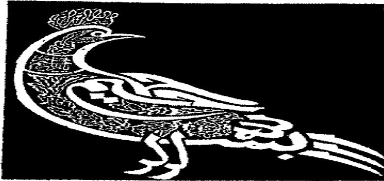
شكل رقم ( ٢ )

شكل رقم ( ٢ ) : بسملة كتبت في هيئة طائر بخط الثلث مع استخدام وحدات من الزهور و الكتابات الصغيرة بداخله .